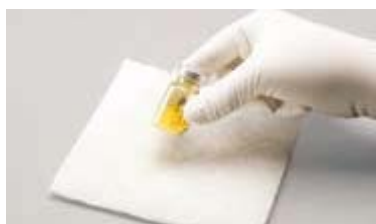
Abbildung A: Zum Mischen fest aufklopfen