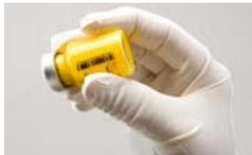
Abbildung C: Energisches Schütteln der Durchstechflasche

Wenn sich Schaum bildet, lassen Sie die Durchstechflasche stehen, bis der Schaum verschwindet. Wenn das Arzneimittel nicht unmittelbar verwendet wird, muss es zum Resuspendieren energisch geschüttelt werden. Zubereitetes ZYPADHERA ist bis zu 24 Stunden in der Durchstechflasche stabil.